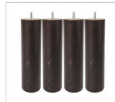
1 jeu de 4 pieds par sommier