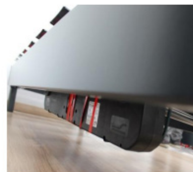
1 moteur avec relais par pile par sommier