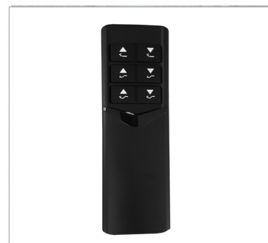
1 télécommande sans fil par sommier

IMPORTANT — À lire soigneusement — À conserver pour consultation ultérieure.