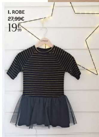
I. ROBE 27,99€ 19€ 99