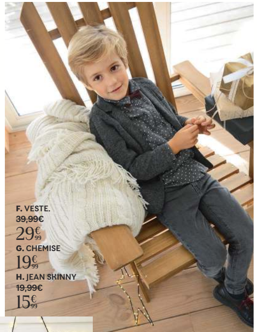
F. VESTE. 39,99€ 29€ 99