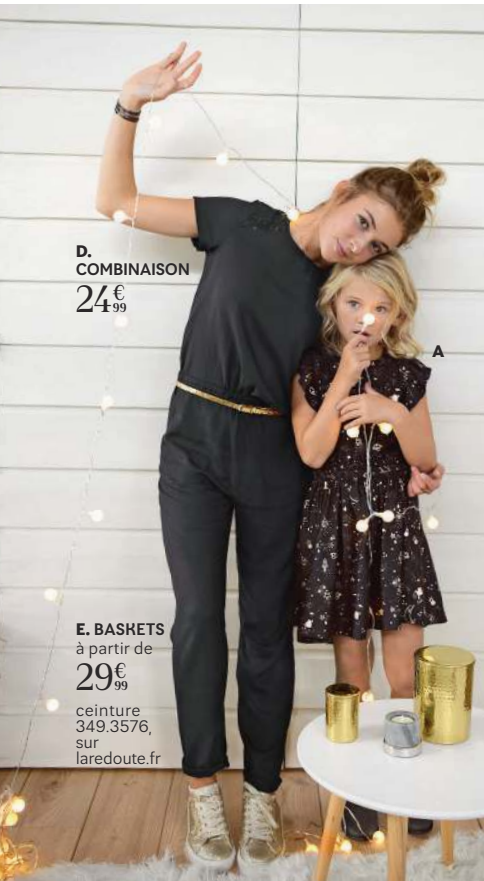
D. COMBINAISON 24€ 99