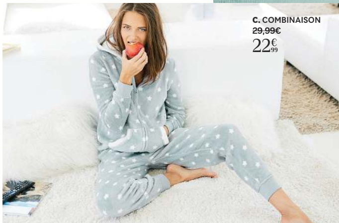
C. COMBINAISON 29,99€ 22€ 99