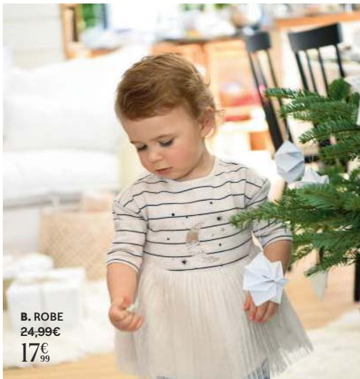
B. ROBE 24,99€ 17€ 99

F. VESTE. Molleton 87% viscose, 13% polyester. Coudières. 1 poche intérieure. Gris foncé 563.3219. Du 3 au 12 ans 39,99€ 29,99€