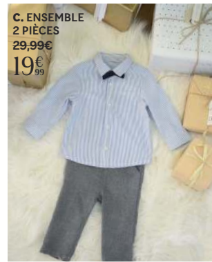
C. ENSEMBLE 2 PIÈCES 29,99€ 19€ 99