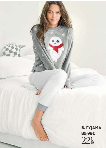
B. PYJAMA 32,99€ 22€ 99