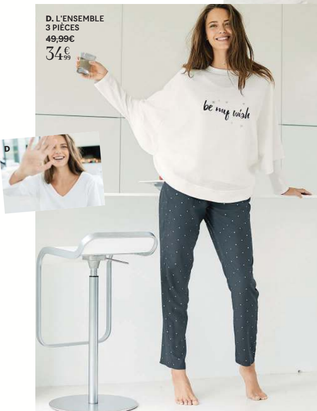
D. L'ENSEMBLE 3 PIÈCES 49,99€ 34€ 99

A. PYJAMA 100% polyester. Ecrû 505.0443 . Du 34/36 au 50/52 32,99€ 22,99€